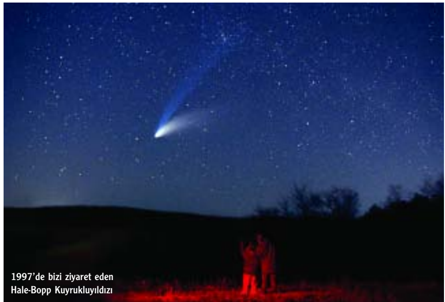
1997'de bizi ziyaret eden Hale-Bopp Kuyruklu Yıldızı

Ay, fotoğrafı en kolay çekilebilecek gök cisimi. Nasıl bir makineyle olursa olsun, deklanşöre bastığınızda, Ay fotoğrafta görünür. Hatta, gündüz fotoğraflarında bile Ay'ı yakalayabilirsiniz. 200