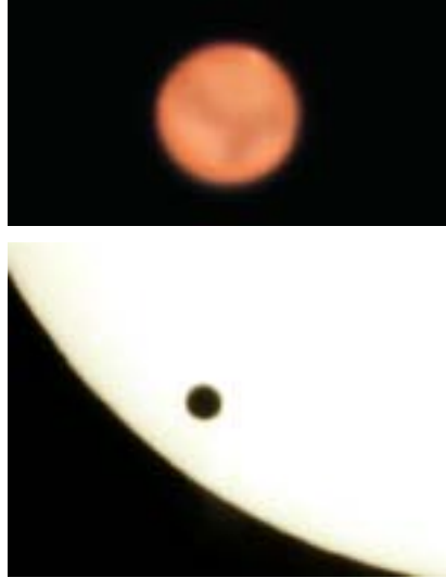
Küçük bir teleskopa bağlanan 400 kilopiksel çözünürlüklü bir Web kamerasıyla, kısa ışıklama süreleriyle çekilen fotoğraflar. Ay fotoğrafı, 8 ayrı fotoğrafın birleştirilmesiyle oluşturuldu. Mars, 29 Ağustos 2003'te, Dünya'ya en yakın olduğu konumdayken çekildi. Sağdaki fotoğrafta 8 Haziran 2004'teki Venüs geçişi sırasında, teleskopa güneş filtresi takılarak çekildi.