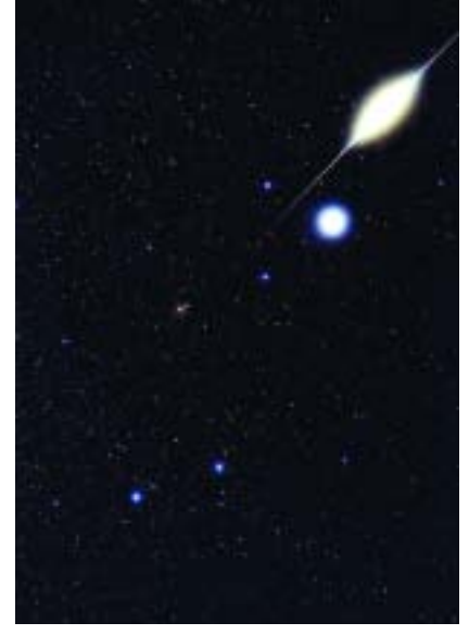
Solda: Bir Leonid (Aslan) Göktaşı Yağmuru sırasında çekilmiş, uzun ışıklı gökyüzü fotoğrafı. Akanyıldızların fotoğrafta bıraktığı izlerden, göktaşı yağmurunun kaynağı kolayca bulunabilir. Sağda: Lir (Çalgı) Takımyıldızı ve bu bölgeden geçen parlayan bir İridium uydusu. Yapay uyduların ne zaman nereden geçeceği ve ne zaman parlayacağı hesaplanabildiğinden, onları fotoğraflarda yakalamak kolay.

mm ya da daha büyük odak uzaklığına sahip olan mercekler kullanırsanız, Ay'daki belirgin yüzey şekillerini de çektiğiniz fotoğraflarda görebilirsiniz.