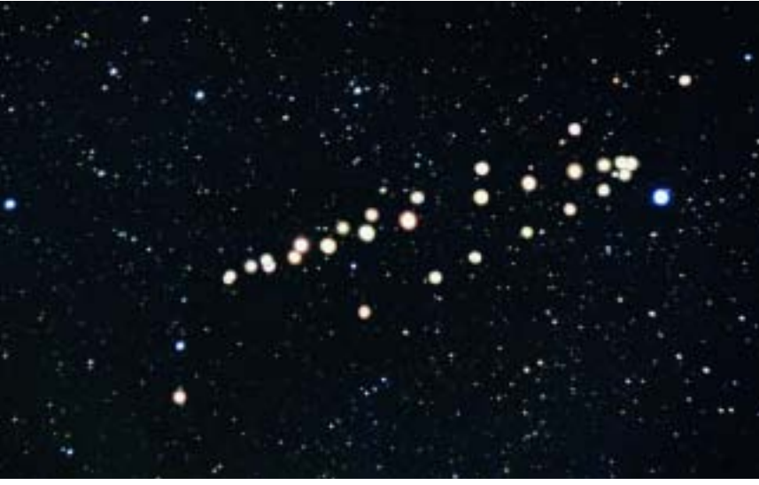
Mars'ın 6 Ocak - 9 Ağustos 1999 tarihleri arasında yaptığı ters hareket. Bu fotoğraf, belli aralıklarla çekilen çok sayıda fotoğrafın, bir görüntü işleme yazılımıyla üst üste yerleştirilmesiyle oluşturulmuş.

sönük olanlarının fotoğrafta belirgin olması için biraz daha hızlı film kullanmak gerekir. 400 ISO'luk bir film, genellikle yeterli olur. Ayrıca diyaframı da en açık ayarda tutmalısınız. Diyafram açık, film de hızlı olduğundan, ışıklandırma sürelerinin de kısa tutulması gerekir. Gökyüzünün ışık kirliliği durumuna göre, beş dakikayla bir saat arasında ışıklandırma süreleri verilebilir. Akanyıldız fotoğrafları çekmek için, en iyi zamanlar, göktaşı yağmurlarının en yüksek etkinliğe ulaştığı geceler.