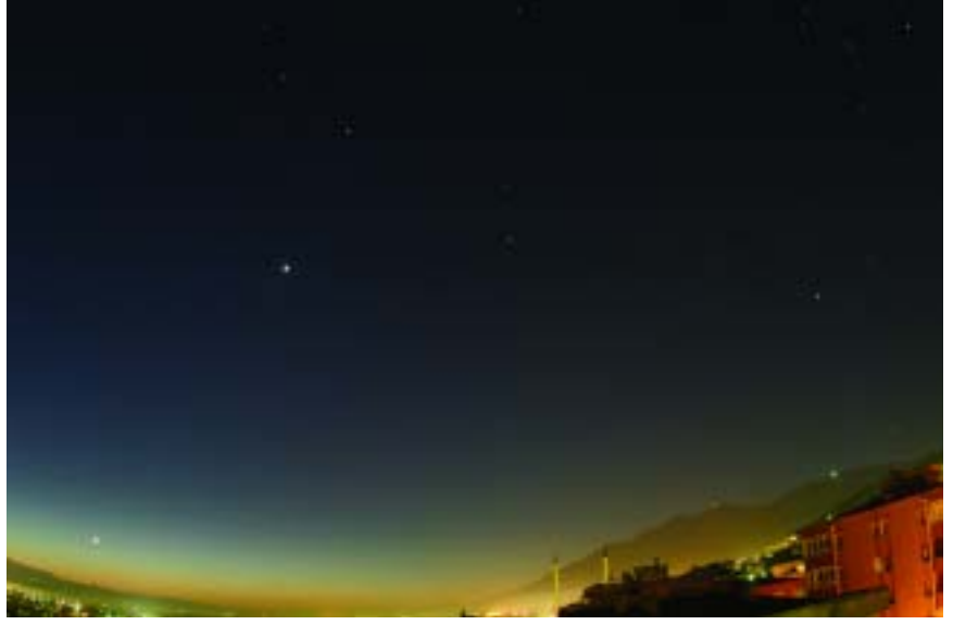
Solda: Beş parlak gezegenin alacakaranlıkta Ankara Beynam Ormanı'ndan çekilen fotoğrafı. Fotoğraf, 400 ISO film ve 40 saniye ışıklatma süresiyle çekilmiş. Sağda: Bursa'dan doğu gökyüzü. Satürn, Venüs, Merkür, Ay ve parlak yıldızlar fotoğrafta görülüyor. Fotoğraf, 17 mm odak uzaklığına sahip mercek, 800 ISO film kullanılarak 20 saniye ışıklandırma ile çekilmiş.

zü fotoğrafları çekecekseniz, yanınızda bolca pil bulundurmaya ihmal etmeyin.